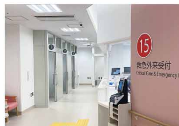
半個室化した待合兼トリアージブース

このようにER棟では、救急外来を受診した全ての方が安心して医療を受けてもらえることを目指し、医療資源を最大限に活用できるよう創意工夫し業務に取り組んでいます。