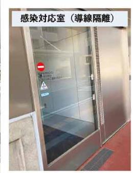
感染対応室(導線隔離)