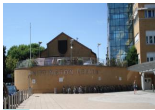
ウィットントン病院