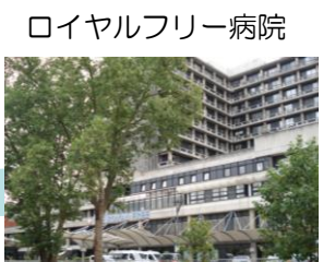
ロイヤルフリー病院

ウィットントン病院、ロンドン大学病院と訪問し、最後にロイヤルフリー病院を訪問しました。ここは、エボラ出血熱感染者がイギリス国内で発生した場合、真っ先に入院となる病院として指定がされています。その入院病棟を特別に見せていただきました。