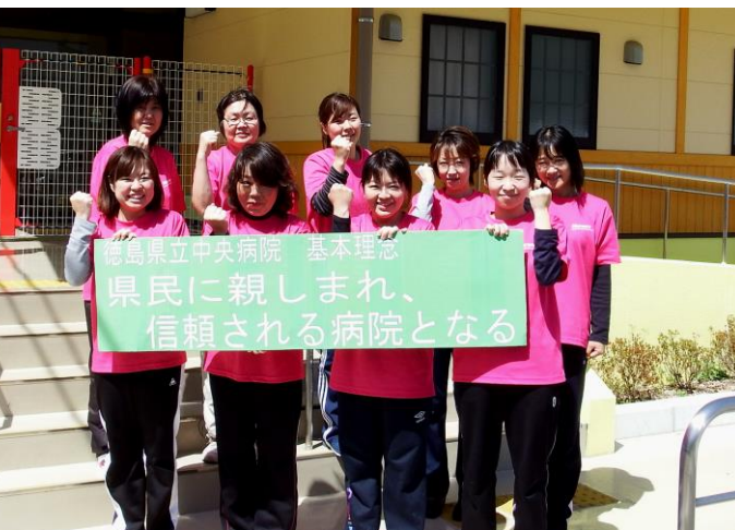
やまもも保育園職員一同