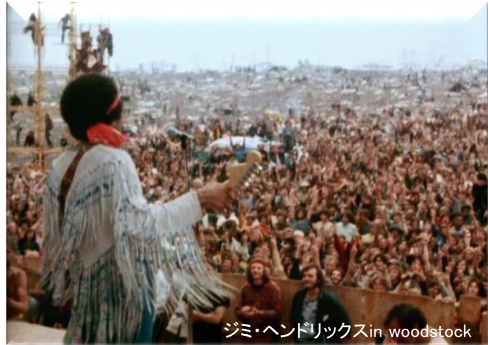
ジミ・ヘンドリックスin woodstock