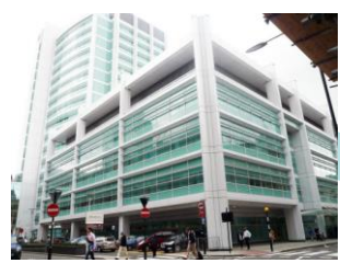
ロンドン大学病院