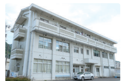
●独身寮(三好病院・海部病院) 徒歩圏内&完全個室の独身寮です。