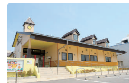
●院内保育(中央病院) 生後2ヶ月~就学前までサポート。