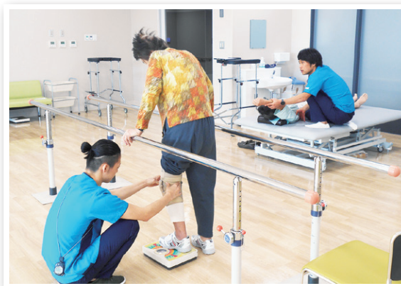
リハビリテーションの様子

当院はこれからも、「地域に寄り添い愛される病院」を目指して、医療ニーズへの対応や医療体制の充実に取り組んでまいります。