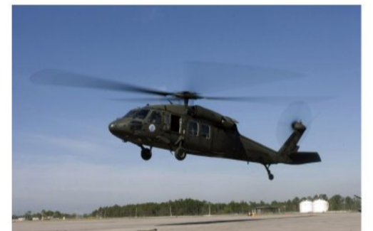
負傷者・物資搬送