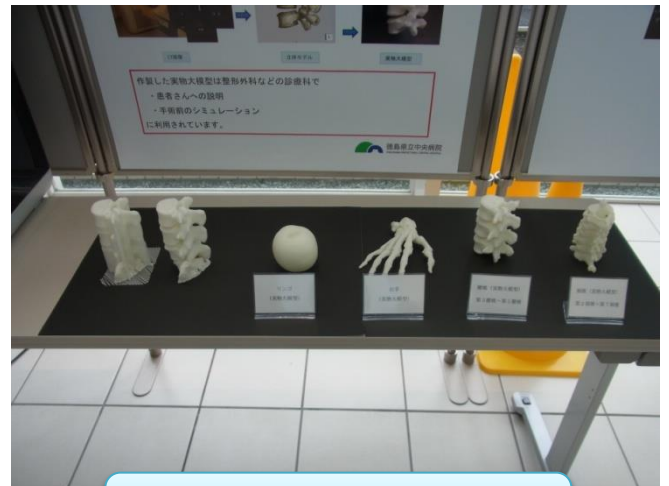
3Dプリンターで作成した模型